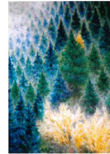
深山 80F 谷口 壽一