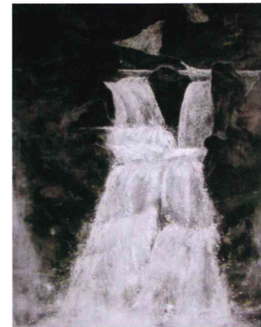
三段峡 50F 高見 陽子