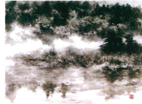
悠久の刻 10F 潮見 冲天