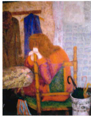
昼下がり 60F 阿部 眞