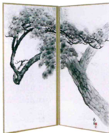
松寿 屏風 大月 紅石