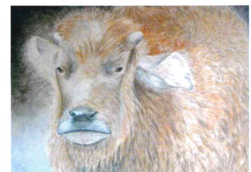
悠(由布島の水牛) 40P 前川 久美子