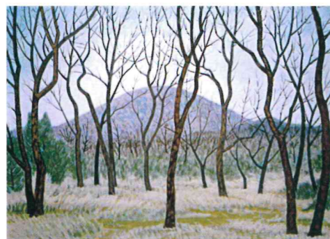
霜月甲山 40P 黒田 衛