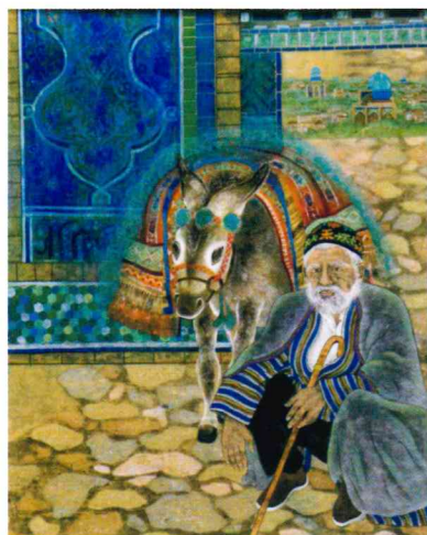
青都 サマルカンド 100F 山市 良子