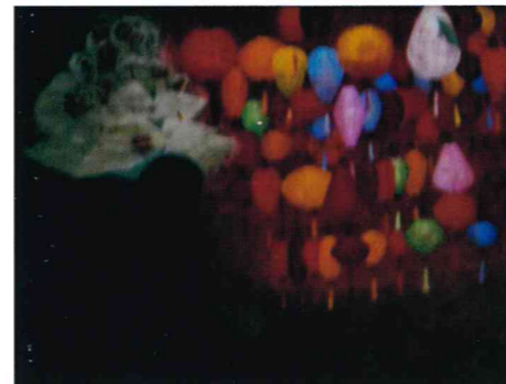
賑わい 50P 島崎 榮