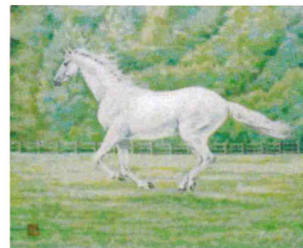
白馬 25F 平尾 文男 2000年亡(88歳)