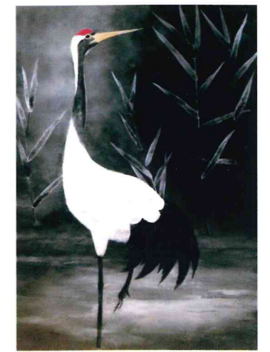
静謐 30F 永井 和佐子