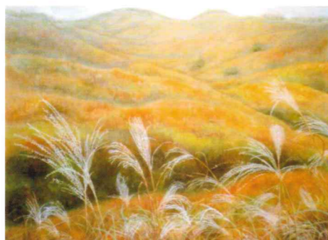
秋深し(砥峰高原) 80F 吉岡 千里