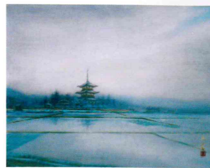
雨あがる 25F 新井 白光 2代会長 2011年亡(99歳)