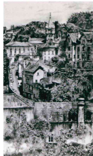
シントラ(ポルトガル)の昼下がり 楠 泰雲 120変