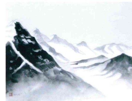
アイガー&ユングフラヨッホ 武田 一華