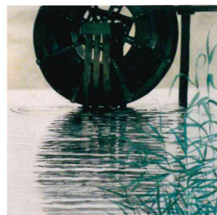
ノスタルジィ 80F 小川 千代子 2003年亡(54歳)

協賛 ギャラリー六軒茶屋 〒665-0836 兵庫県宝塚市清荒神1丁目11-23 TEL 0797-81-6515