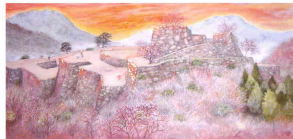
夕映えの古城址 100変 前田 蓉子