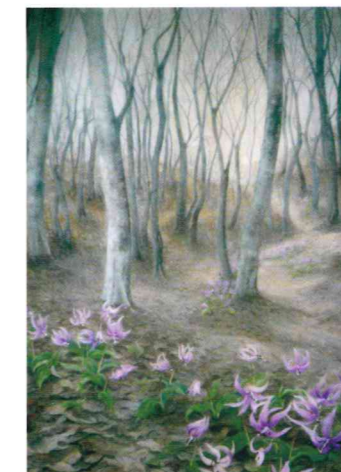
めぐり来る季節 50F 古田 智子