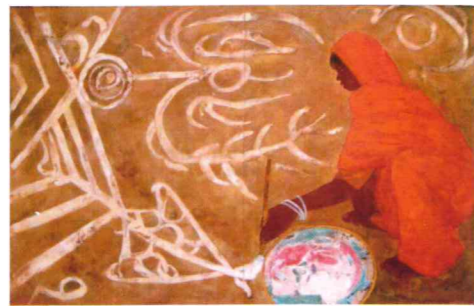
左手で筆をもつダルシヤナ 200変 桑田 敬子