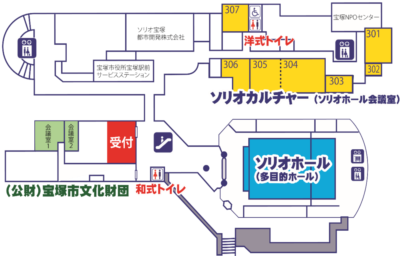
ソリオホール3Fフロアマップ