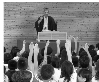
出前落語(山手台小学校)