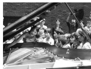
ベガでマイベスト ワークショップ